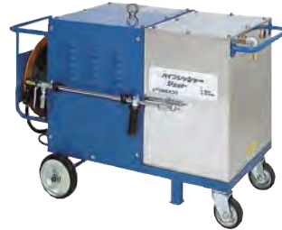
■ ポンピング ワッシャー