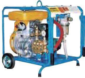
■ エンジン ジェットー