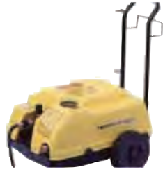
■ 100V ミニジェットー