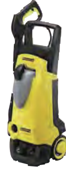
■ 100V 高圧洗浄機